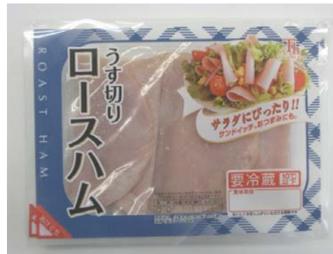
うす切りロースハム