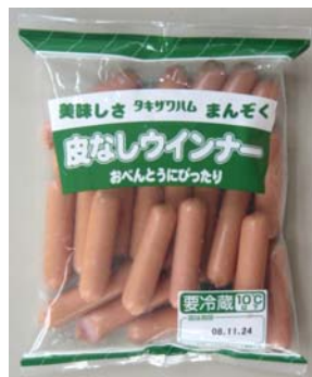
まんぞく皮なしウインナー