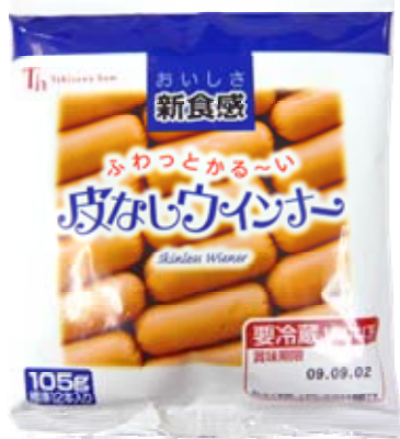
ふわふわ皮なしウインナー