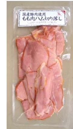
ももハム切り落とし